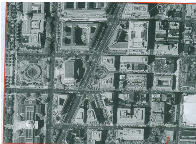
фиг.2. Снимка на един от районите на гр. Вашингтон

Втората група по активност в разработката и експлоатацията на спътникови системи за оптикоелектронно разузнаване са Европейските страни Франция, Германия и Великобритания, стремящи се да получат независими от САЩ средства за събиране на информация (фиг.2).