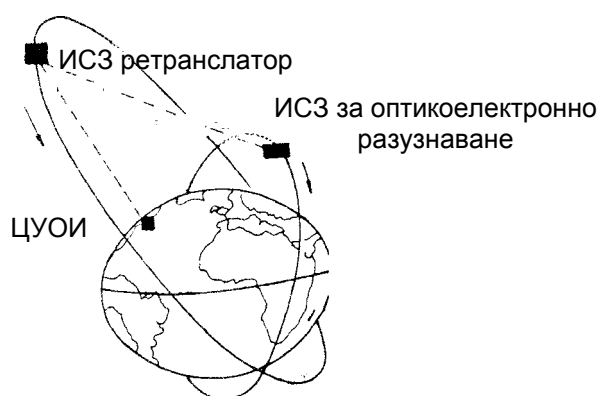
фиг. 1. Принципна конфигурация на космическа система за оптикоелектронно разузнаване

Спътниците за оптикоелектронно разузнаване, успешно използвани и в наши дни, функционират в рамките на военнокосмическа система [ 4 ] с три подсистеми: спътници за оптикоелектронно разузнаване (не по-малко от два), подсистема от три спътника – ретранслатора и наземен център за управление и обработка на информацията (фиг. 1).